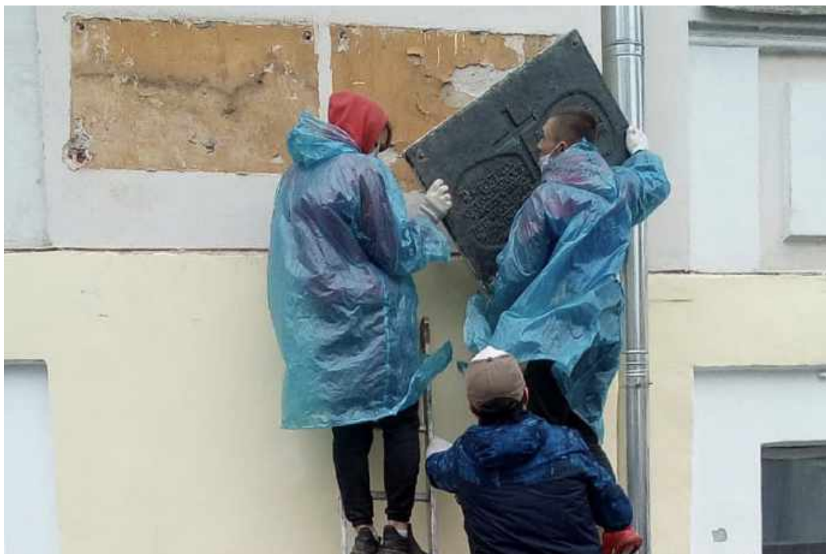
Демонтаж мемориальных досок в память жертв Большого террора и Катынского расстрела в Твери, май 2020 г.