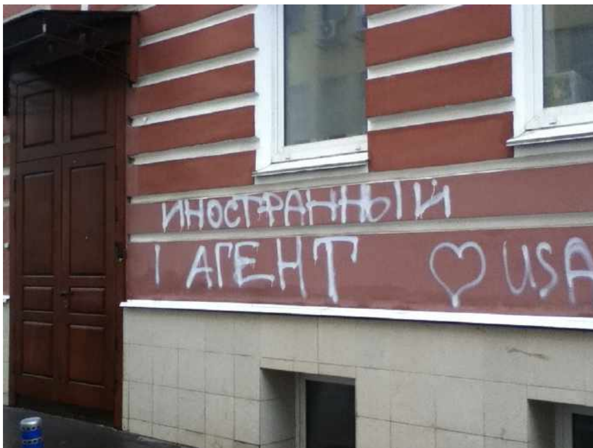
Слова «Иностранный агент! ♥ США», написанные аэрозольным баллончиком с краской на фасаде офиса Международного Мемориала.

входной дверь. Инцидент произошел накануне вступления в силу закона об «иностранных агентах» 217 . Полиция не предприняла никаких действий.