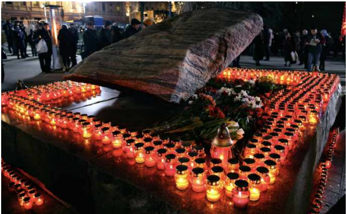
Памятник на Лубянской площади во время недавней церемонии «Возвращение имен».