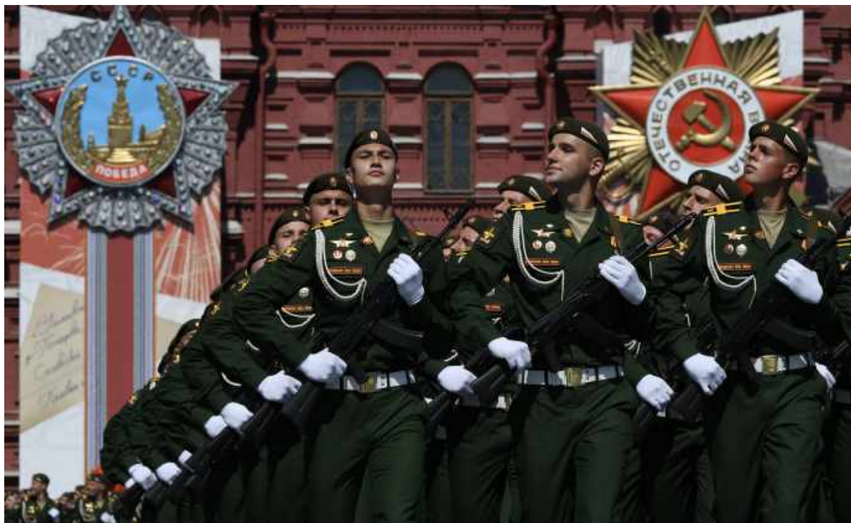
Шествие военнослужащих на Красной площади в Москве во время военного парада 9 мая 2020 года. Несмотря на стремительное распространение обнаруженного незадолго до парада вируса Covid-19, Кремль не отменил празднование 75-летия победы во Второй мировой войны.

4 статьи 67.1) 6 . Преемственность с Советским Союзом, святость победы Советского Союза во Второй мировой войне и государственная монополия на историю включены в основу современной политической системы России. Как сказал один из респондентов, «история победоносного Советского Союза» является «исторической скрепой нынешнего режима [в России]» 7 .