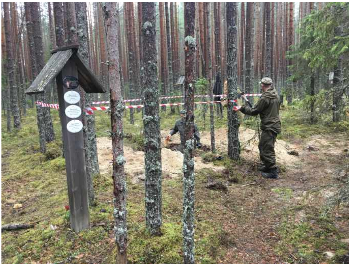
Сотрудники Российского военно-исторического общества завершают раскопки в урочище Сандармох, на месте массовых расстрелов во время Большого террора. конец августа 2018 г.